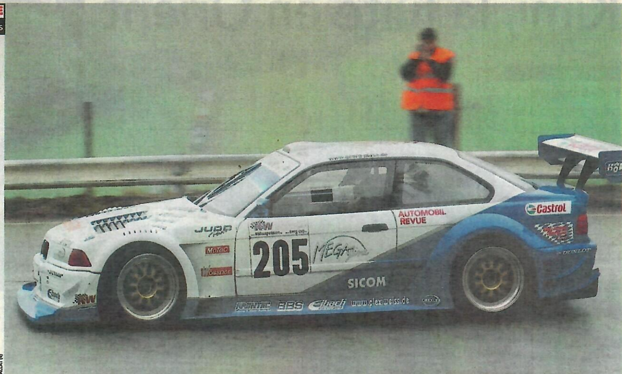
Il est venu, il a vu et il a vaincu! L'Allemand Georg Plasa a su dompter la route détrempée des Rangiers et y imposer son extraordinaire BMW 320 à moteur Judd.

mement humide ou seulement mouillé, l'état de la piste n'a jamais été rassurant. De multiples pièges se sont ainsi refermés sur quelques pilotes ressortis, par bonheur, toujours indemnes d'impressionnantes cabrioles.