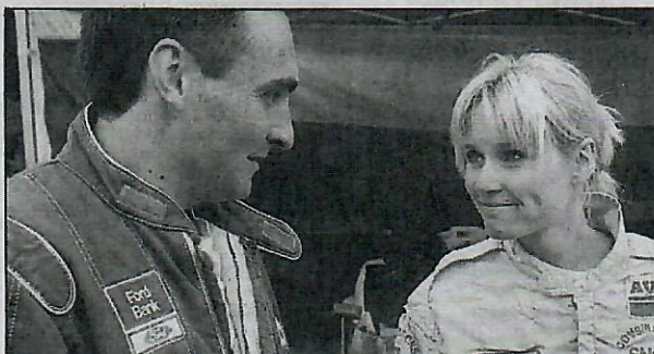
Un regard qui en dit long entre les époux Pfeuti.